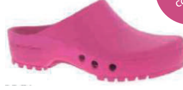
Réf : 32457 - Fuchsia